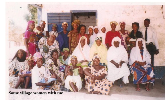
Some village women with me

Rotary Club Eindhoven 80 jaar Lustrum project "Seyone Community Building"